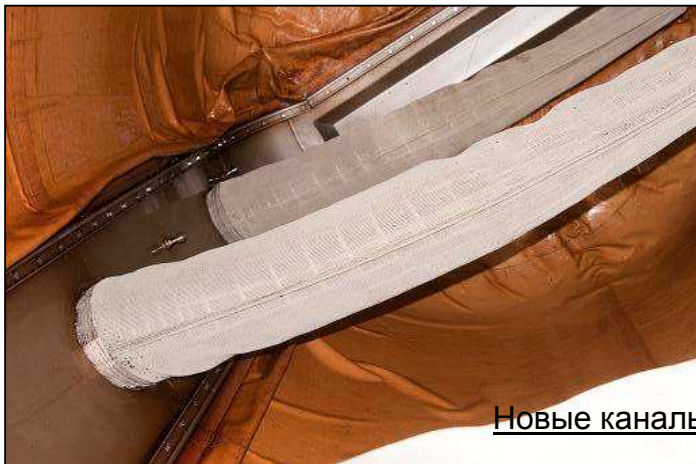
Новые каналы Flexidrain в S24 и после